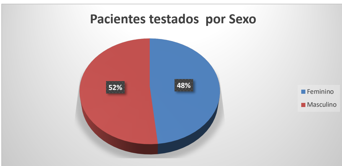
Gráfico 2. Número de pacientes testados por sexo entre 04/03/2020 a 23/04/2020.