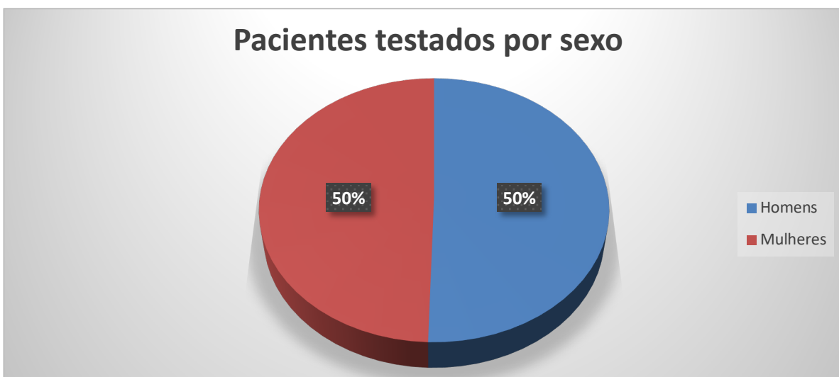
Gráfico 2. Número de pacientes testados por sexo entre 04/03/2020 a 25/04/2020.