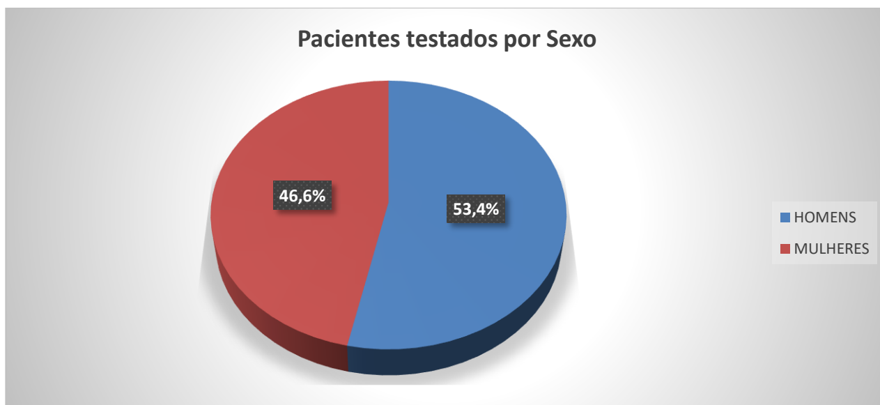
Gráfico 2. Número de pacientes testados por sexo entre 04/03/2020 a 04/05/2020.