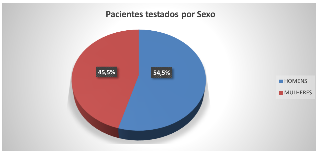
Gráfico 2. Número de pacientes testados por sexo entre 04/03/2020 a 11/05/2020.