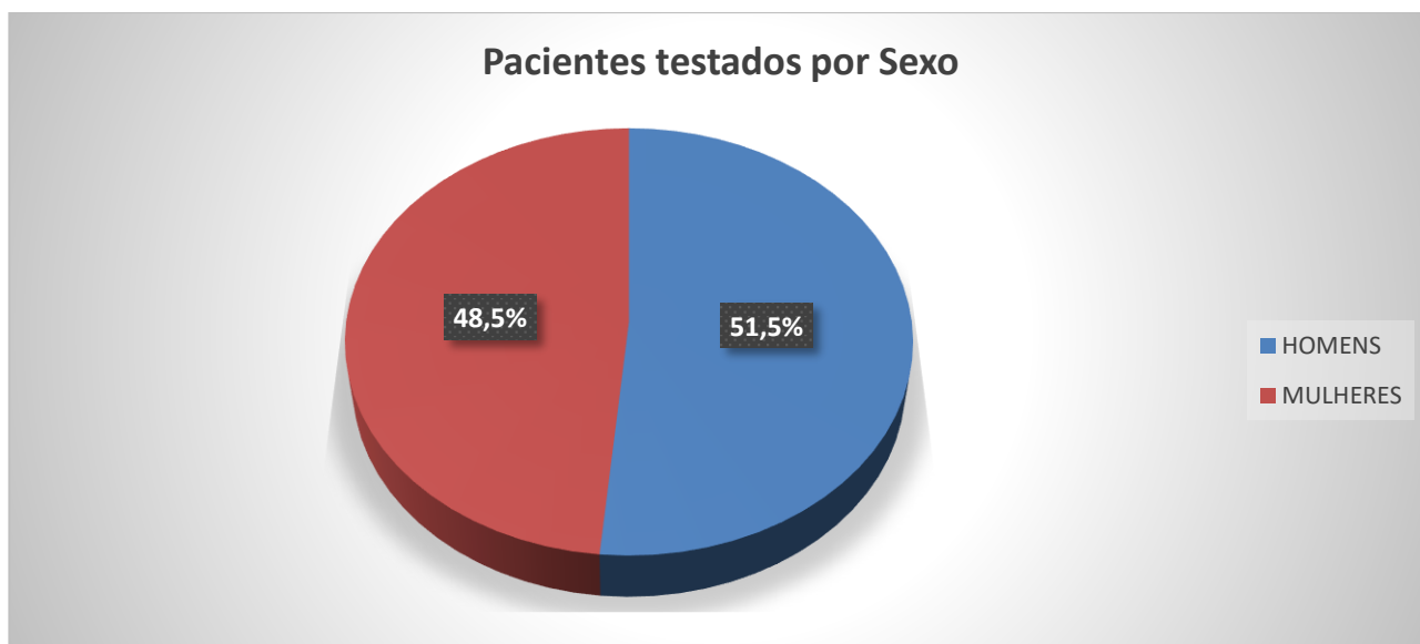
Gráfico 2. Número de pacientes testados por sexo entre 04/03/2020 a 30/04/2020.