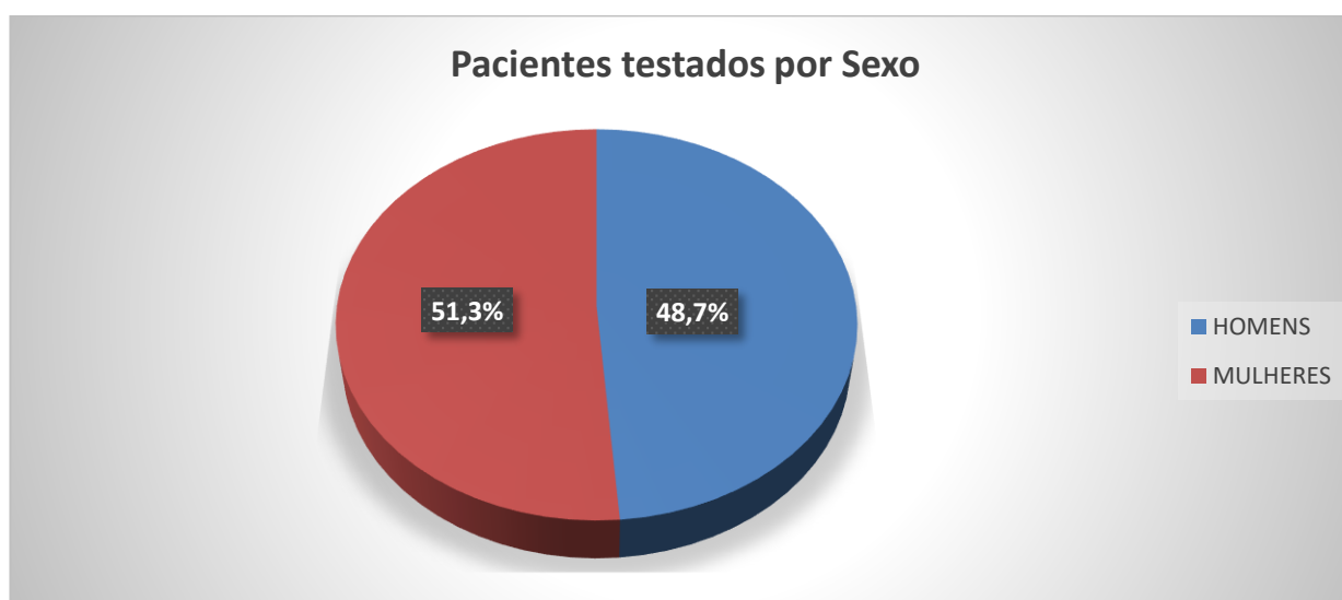
Tabela 3. Perfil epidemiológico de casos positivos (colaboradores) submetidos a exames para detectar SARS-COV2 do dia 04/03/2020 a 07/06/2020.

Gráfico 2. Número de pacientes testados por sexo entre 04/03/2020 a 07/06/2020.