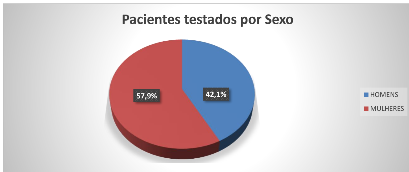
Gráfico 1. Número de pacientes testados por sexo entre 04/03/2020 a 03/08/2020.

2. Perfil epidemiológico de casos positivos (colaboradores) submetidos a exames para detectar SARS-COV2 do dia 04/03/2020 a 03/08/2020.