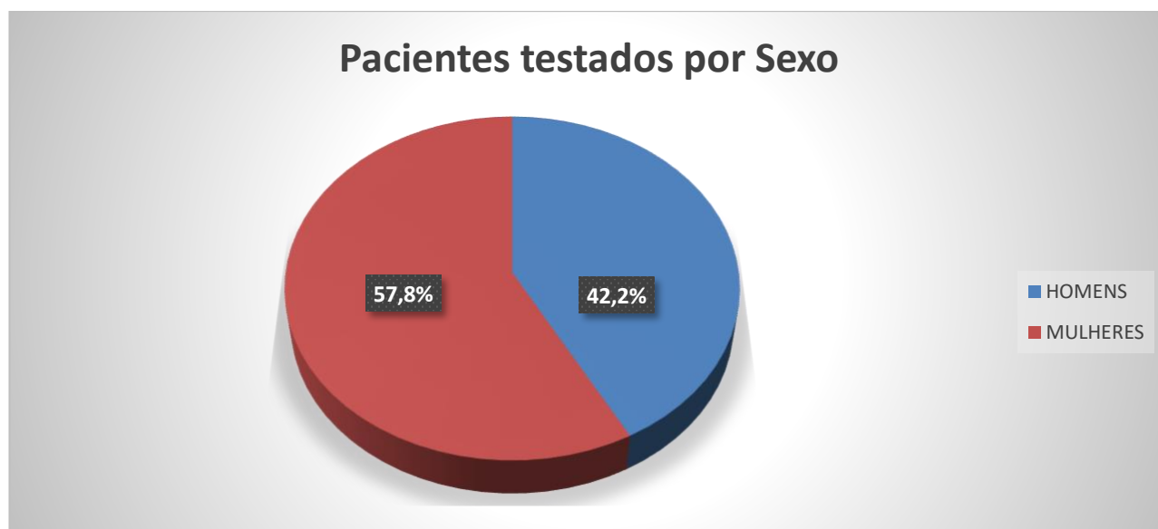
Gráfico 1. Número de pacientes testados por sexo entre 04/03/2020 a 06/08/2020.

* 4 foi o número de óbitos referentes às últimas 24 horas.