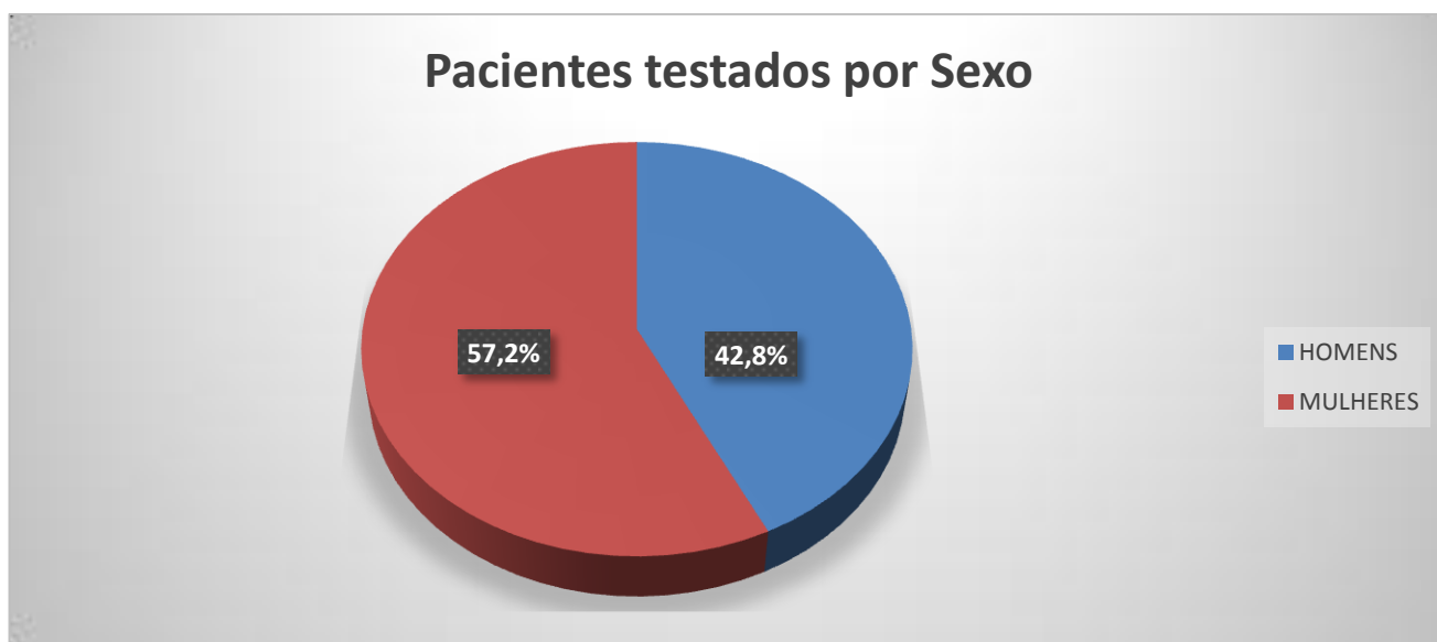
Gráfico 2. Perfil epidemiológico de casos positivos (colaboradores) submetidos a exames para detectar SARS-COV2 do dia 04/03/2020 a 23/07/2020.