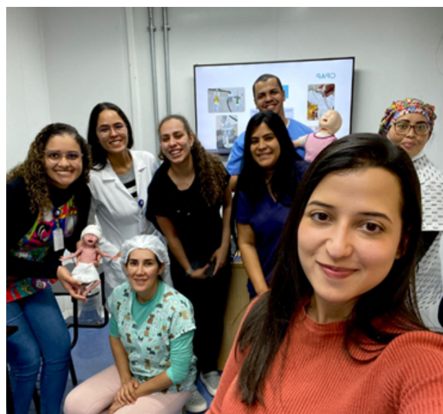
Núcleo de Educação Permanente do IGESDF - NUDEP/GGCON

Esta iniciativa demonstra o compromisso do Núcleo em capacitar os colaboradores com excelência, utilizando nossos equipamentos realísticos. O curso abrangeu técnicas de fixação de tubo, ventilação mecânica não invasiva e parâmetros admissionais de Ventilação Mecânica Invasiva. Os participantes simularam a admissão de um paciente pediátrico na ventilação mecânica invasiva, baseado em caso clínico discutido, proporcionando aos colaboradores uma experiência enriquecedora e dinâmica.