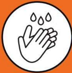
Higiene das Mãos

Devem ser adicionadas às precauções padrão.